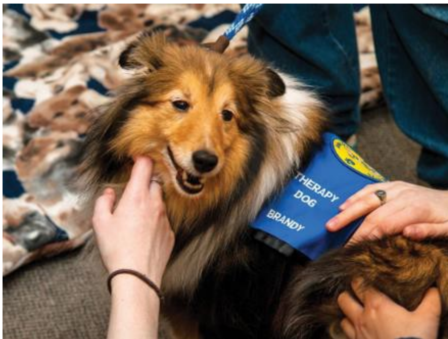
Abbildung 1: Therapiehund Brandy bei der Arbeit. Anmerkung: Lannon und Harrison (2015, S. 18).