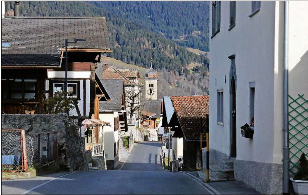
La via atras Vuorz ei stretga. Biars vischins ein buca prompts d'acceptar in augment dil traffic da transit.