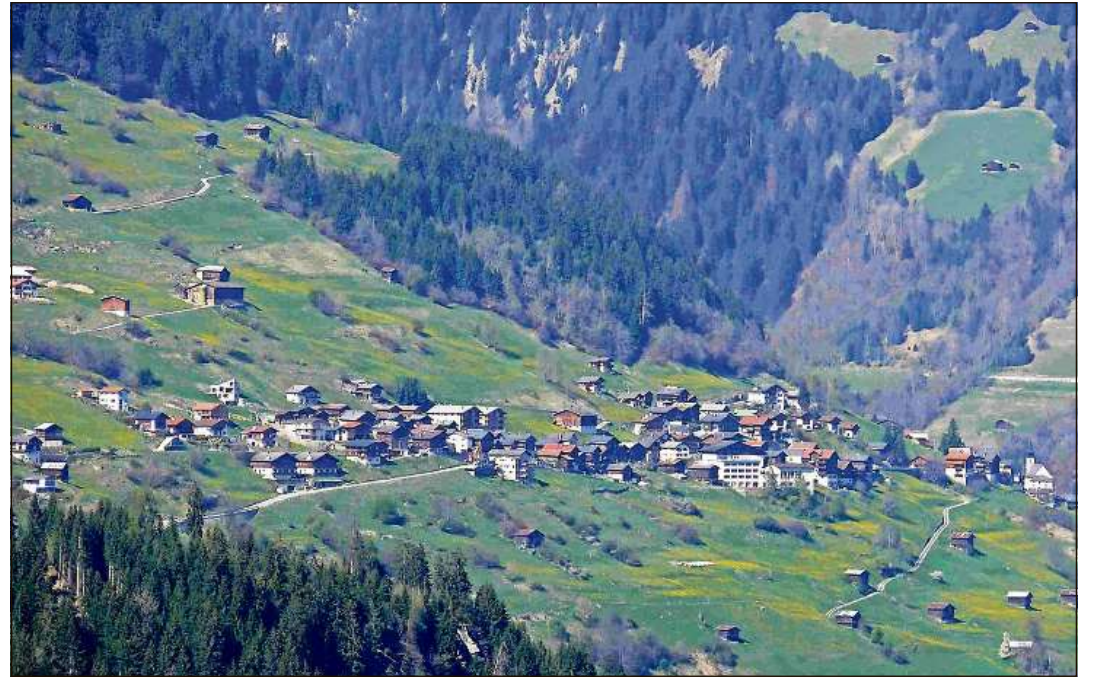
Cun rodund 200 habitonts ei Andiastr (foto) la pintga dallas treis vischnauncas. Vuorz dumbra 340 e Breil rodund 1260.