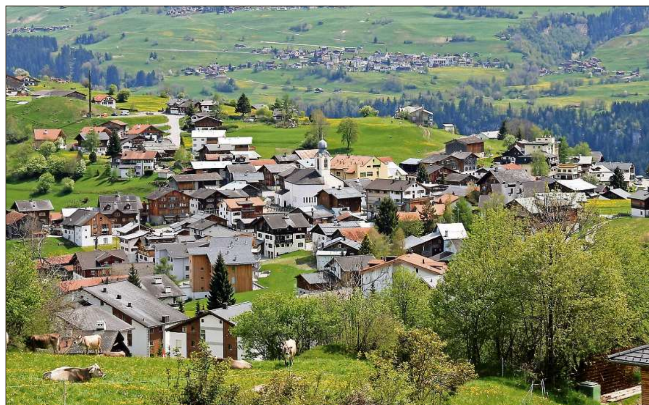
La vischnaunca nova duei purtar il num da Breil. Nossa foto muossa il vitg da Breil.